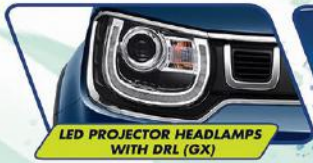
LED PROJECTOR HEADLAMPS WITH DRL (GX)

Desain baru yang dinamis untuk tampilan makin stylish