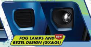
FOG LAMPS AND BEZEL DESIGN (GX&GL)

Headlamps yang tegas dengan cahaya yang terang, aman untuk berkendara