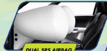
DUAL SRS AIRBAG

Melalui berbagai teknologi keamanan terkini, NEW IGNIS berikan ketenangan serta kenyamanan saat berkendara.