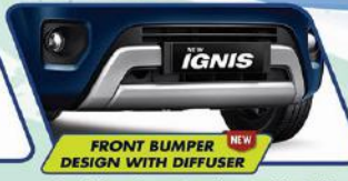
FRONT BUMPER DESIGN WITH DIFFUSER

Tampilan baru bagian belakang kini semakin dinamis