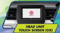
HEAD UNIT TOUCH SCREEN (GX)

Keseruan perjalanan dalam genggaman dengan kontrol audio pada stir