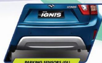
PARKING SENSORS (GL)

Tampilan NEW IGNIS yang unik, sporty, dan stylish semakin terlihat dengan tambahan bermacam aksesoris yang menambah nilai gaya hidup urban.