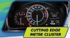
CUTTING EDGE METER CLUSTER

Serunya eksplorasi dengan mode touchscreen