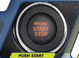
PUSH START STOP BUTTON (GX)

Mesin yang efisien dapat diandalkan untuk setiap perjalanan