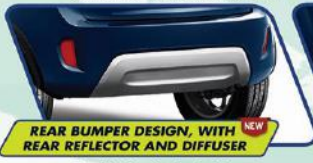
REAR BUMPER DESIGN, WITH REAR REFLECTOR AND DIFFUSER

Desain baru untuk tampilan semakin elegan