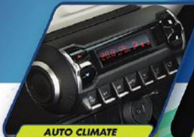
AUTO CLIMATE A/C WITH HEATER (GX)

NEW IGNIS sebagai generasi baru URBAN SUV, hadirkan fitur-fitur berkelas. Mendukung mobilitas perkotaan yang dinamis baik dari sisi kenyamanan, keamanan, dan juga power.