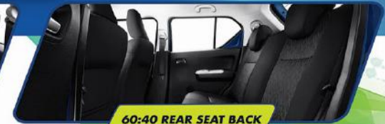
60:40 REAR SEAT BACK