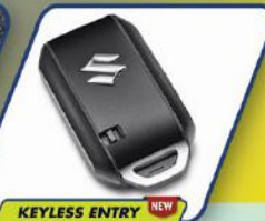
KEYLESS ENTRY (GX)

Praktis dan dinamis dengan Push Start Stop Button