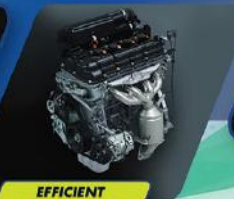
EFFICIENT K12M ENGINE

Mesin yang efisien dapat diandalkan untuk setiap perjalanan