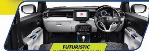
FUTURISTIC INSTRUMENT PANEL